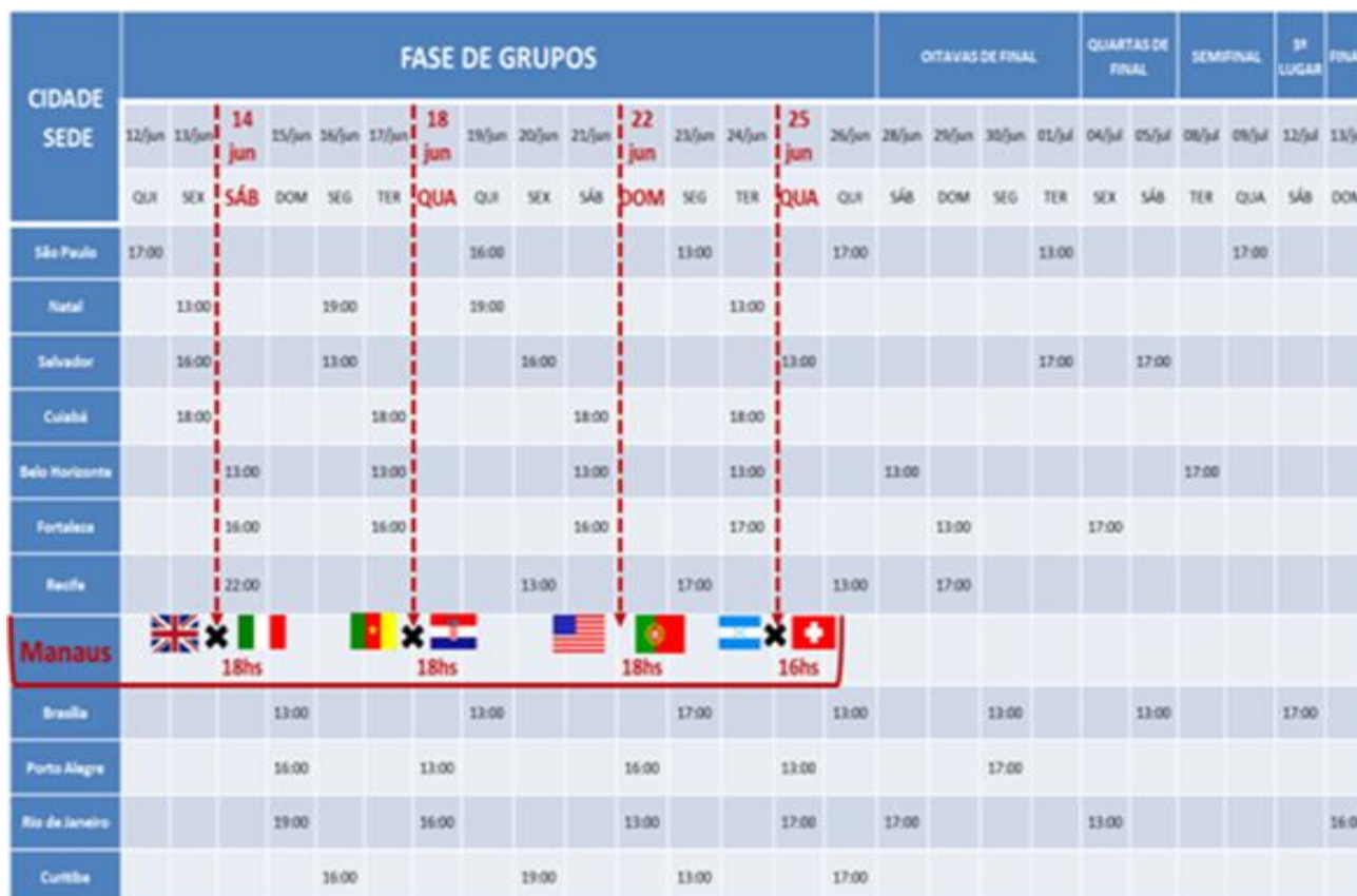
Figura 1: Tabela dos Jogos da Copa do Mundo FIFA Brasil 2014™.

Os jogos da Copa do Mundo FIFA Brasil 2014™ foram realizados conforme a FIG. abaixo (doc. 2), na qual estão destacados os jogos que foram realizados na Arena da Amazônia.